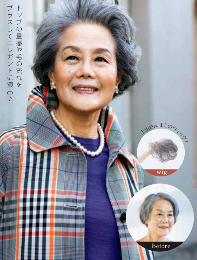
トップの量感や毛の流れを プラスしてエレガントに演出♪