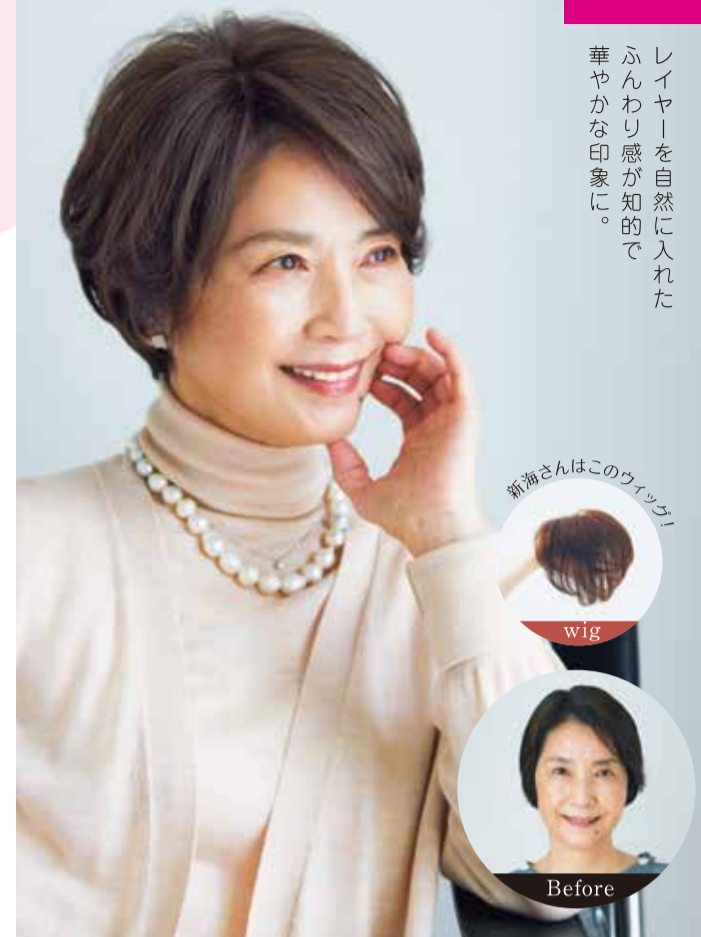
レイヤーを自然に入れた ふんわり感が知的で 華やかな印象に。

ポイント ピン代わりに「ピタッとキャッチ」 手で押さえるだけで、ウィッグがピタッとフィット する構造。ピン代わりになるほどお手軽です。