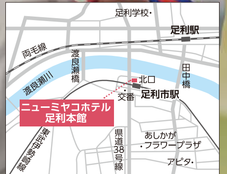
【電車】東武伊勢崎線「足利市駅」出ですぐ

13日(月) 午後1時～午後6時 14日(火) 午前10時～午後6時 15日(水) 午前10時～午後5時