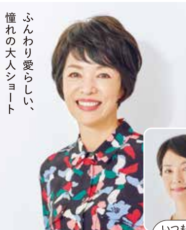
ふんわり愛らしい、 憧れの大人シヨート