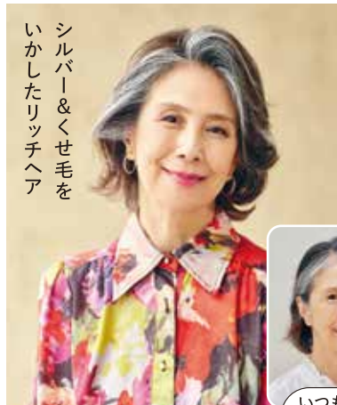
シルバー&くせ毛を いかしたリッチヘア