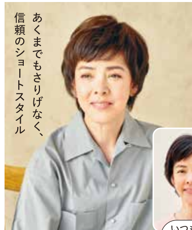
あくまでもさりげなく、 信頼のシヨートスタイル