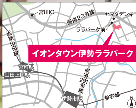
[バス] 伊勢市駅より「ララパーク前」バス停からすぐ