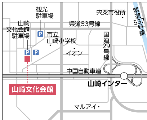
【車】中国自動車道「山崎インター」より約5分