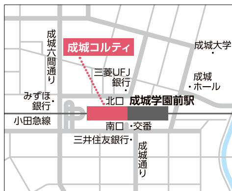
【電車】小田急線「成城学園前駅」直結