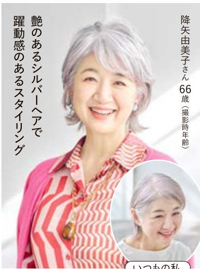
艶のあるシルバーヘアで躍動感のあるスタイリング