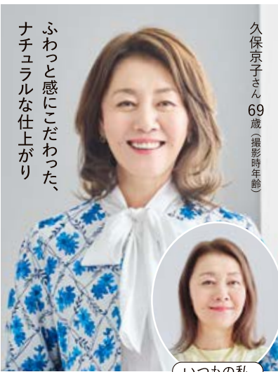
ふわっと感にこだわった、ナチュラルな仕上がり