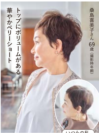
トップにボリュームがある華やかベリーショート