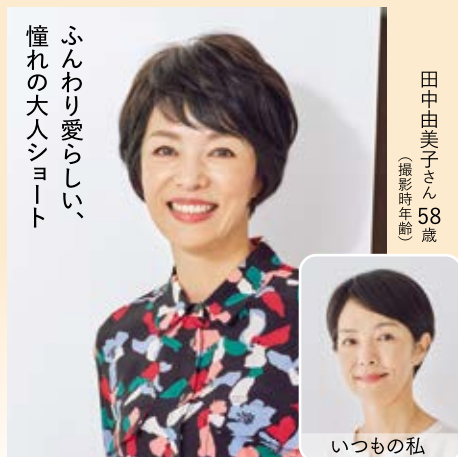
ふんわり愛らしい、憧れの大人ショート