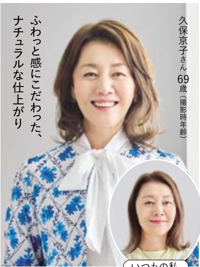
ふわっと感にこだわった、ナチュラルな仕上がり