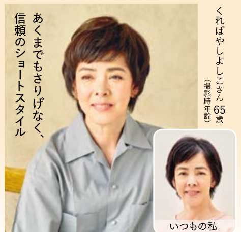
あくまでもさりげなく、信頼のショートスタイル