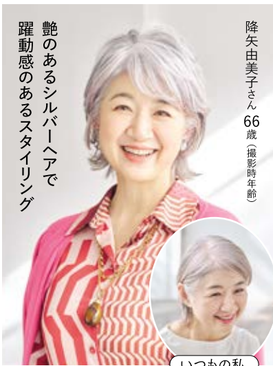
艶のあるシルバーヘアで躍動感のあるスタイリング