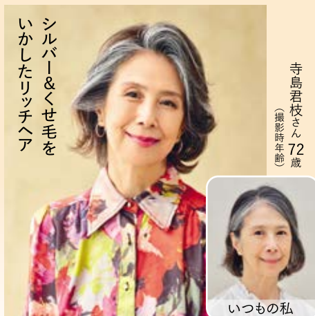
シルバー&くせ毛をいかしたリッチヘア