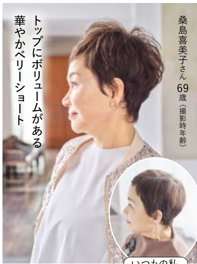
トップにボリュームがある華やかベリーショート