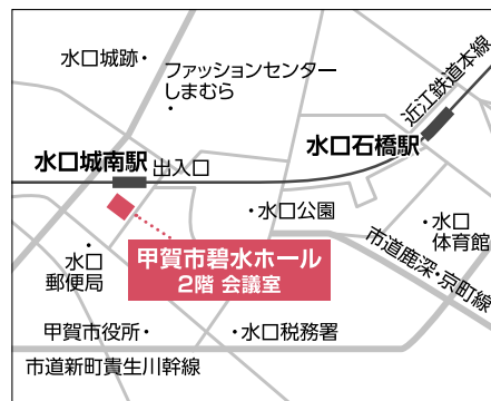
【電車】近江鉄道本線「水口城南駅」より徒歩約3分