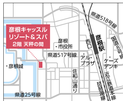
【電車】彦根駅より徒歩約8分