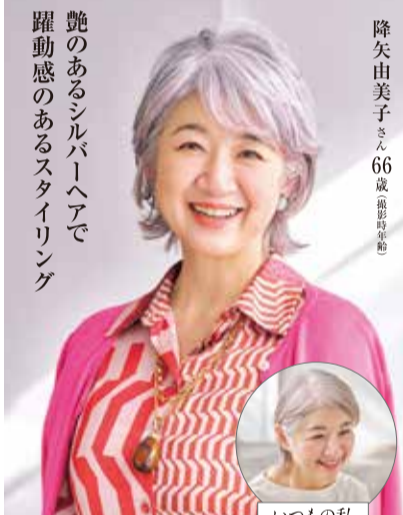
艶のあるシルバーヘアで躍動感のあるスタイリング