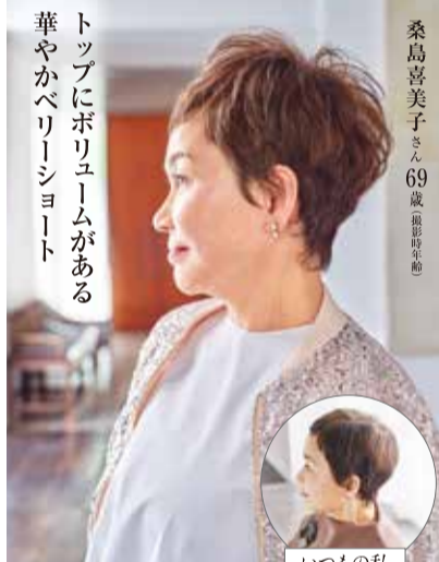
トップにボリュームがある華やかベリーショート