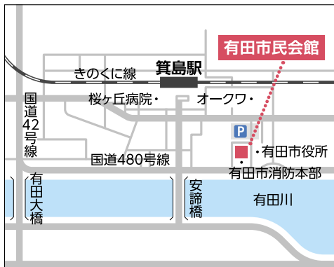
【電車】きのくに線「箕島駅」より徒歩約6分