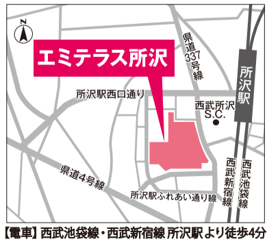
【電車】西武池袋線・西武新宿線 所沢駅より徒歩4分