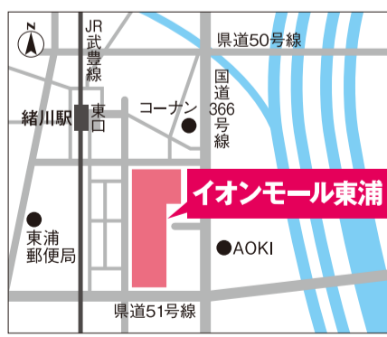
【電車】JR緒川駅下車すぐ(無料駐車場あり)