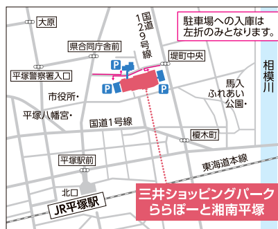
【電車】JR東海道本線「平塚」駅より徒歩約12分