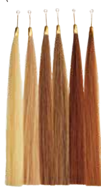
※実際の色とは異なる場合があります。