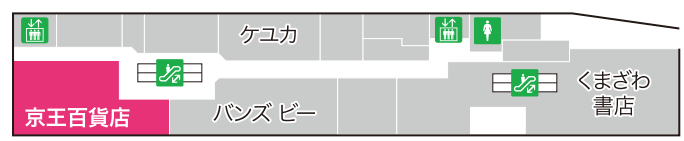
A館4階 フロアマップ