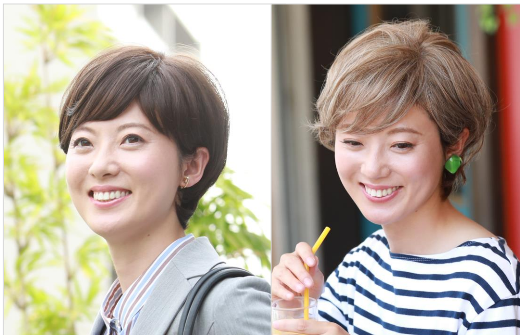
『エッグショート』使用例 (写真:左・ナチュラルブラウン、右・ハニーグラデーション)

髪色は肌なじみの良い立体感のあるナチュラルブラウン、肌を明るくみせてくれるゴールドブラウン系の数量限定カラーのハニーグラデーションの2色から選べます。