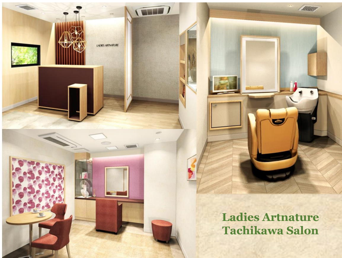
Ladies Artnature Tachikawa Salon

～ JR線立川駅北口より徒歩4分。緑川通り沿いに移転 ～ レディースアートネイチャー 立川サロン 6月5日(金) 移転リニューアルオープン！