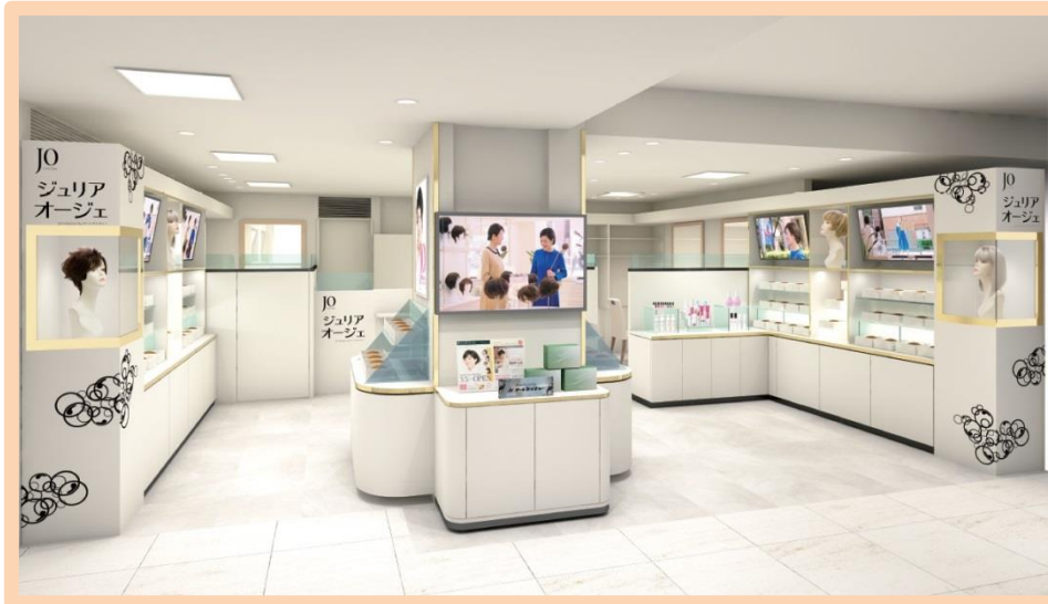
ジュリア・オージェ 東武百貨店船橋店 (イメージ図)