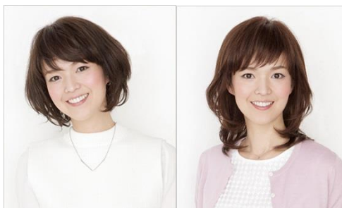
医療用ウィッグ『アックス』