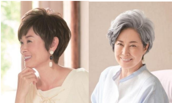
新・さららオール(写真左) 新・さらら 25FP(写真右)

『新・さらら』は、自毛や肌になじむグラデーション縫製でより柔らかく、しなやかにフィット。前髪の肌なじみもより自然になりました。人気の部分ウィッグは2サイズから選べるほか、新たにスタイリッシュなオールウィッグもラインナップにプラス。髪色もご要望の高いダーク系、白髪に自然になじむグレイッシュカラーを追加するなど、彩りゆたかなカラーを取り揃えました。