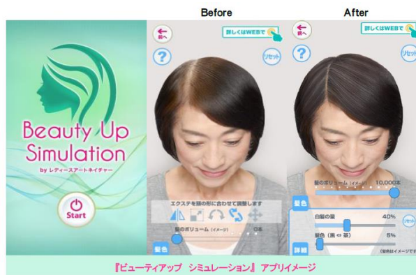
『ビューティアップ シミュレーション』アプリイメージ