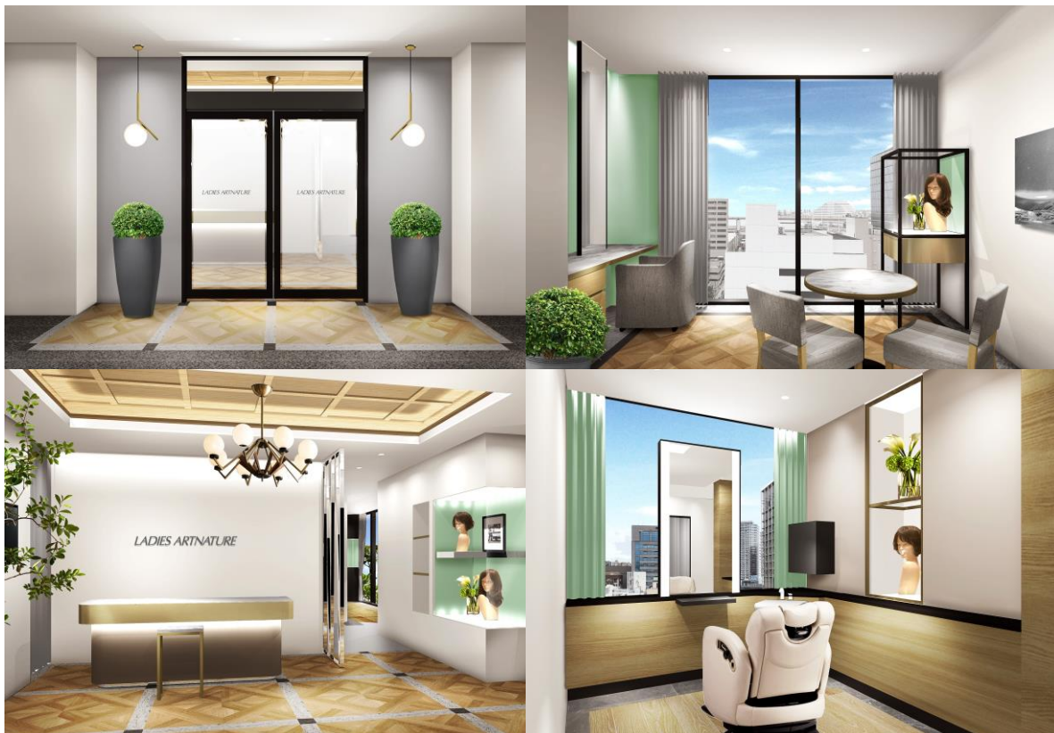
Ladies Artnature Kobe Salon

～ 旧居留地・大丸前駅B1出口より徒歩2分 ～ レディースアートネイチャー 神戸サロン 1月11日(金) 移転リニューアルオープン！