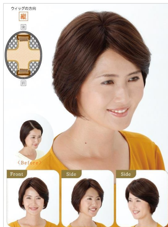
クロスフリー使用例