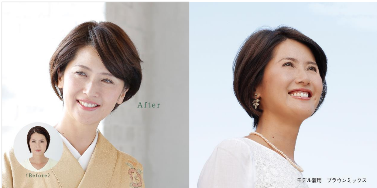
クロスフリー使用例

新商品『クロスフリー』はオールハンドメイドのベースネットを十字に配した”クロスフリーデザイン”が特長の手のひらサイズのウィッグです。縦・横・斜めなど、お好きな方向でつけることができるので分け目、トップ、前髪と使い方次第で自由自在に髪をボリュームアップすることができます。