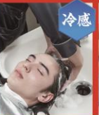
スカルプシャンプー & コンディショナー