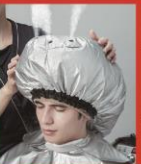
ミストサウナ (ミスティーカー)