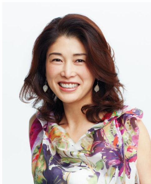
【ビューティアップ使用例】