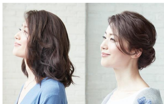
『ピュアシエル』ヘアアレンジ例

http://www.julliaolger.jp/shop/index.html/