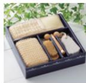
ピュアバスタイム5点セット