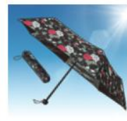
晴雨兼用折りたたみ傘