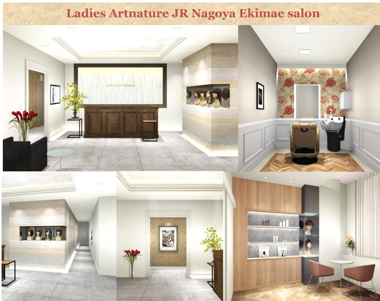
※サロンイメージ図

なお、名古屋市内の女性専用サロンは、名古屋駅前の「レディースJR名古屋駅前サロン」と栄地区の「レディース名古屋栄サロン」(旧レディース名古屋サロン/5月26日より店名変更)の2店舗体制となります。名古屋駅をご利用される周辺地域の皆さまにより親しんでいただける店舗となれるよう、スタッフ一同、ご来店をお待ち申し上げます。