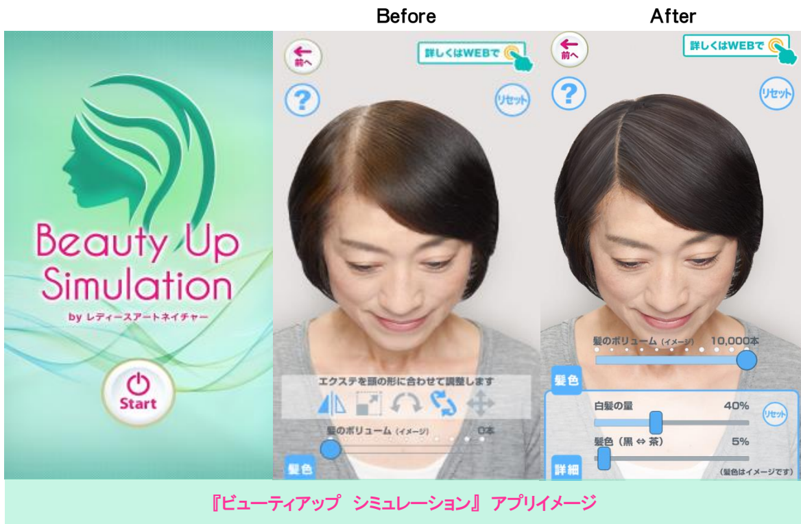
『ビューティアップ シミュレーション』アプリイメージ

『ビューティアップ シミュレーション』は、昨年9月に発売した人気の女性用ヘアエクステ『Beauty Up(ビューティアップ)』で髪を増やすイメージを気軽に体験できるアプリです。増やす髪の本数は、最大で10,000本まで可能。3つの角度から気になる分け目や白髪の量、髪の色など、細かい設定ができるのでよりリアルで理想的な髪のボリュームを画面上で確認することができます。