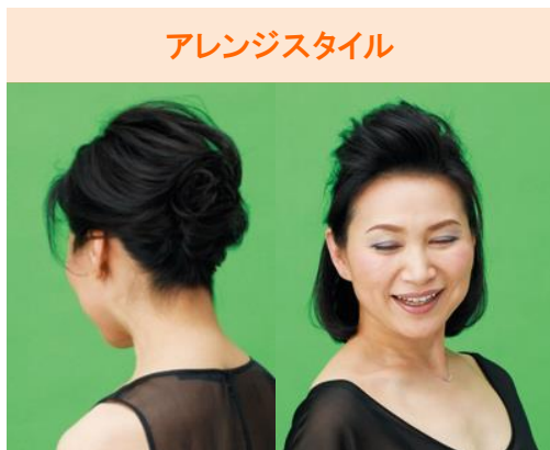
アレンジスタイル