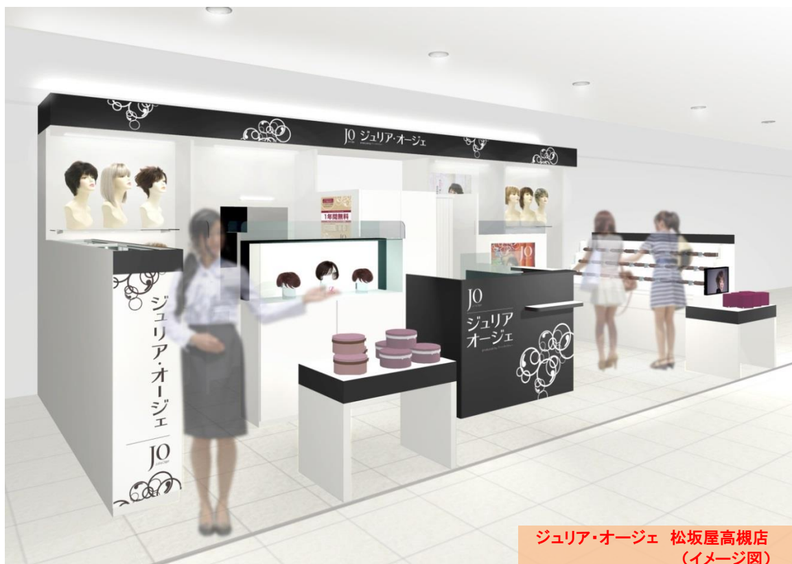
ジュリア・オージェ 松坂屋高槻店 (イメージ図)

関西大都市圏の大阪・京都の中間に位置し、アクセスも良好なJR「高槻」駅周辺は、近年大規模な再開発が進み、新たな賑わいを見せる注目のエリアです。駅南側の松坂屋高槻店1階に新規オープンする「ジュリア・オージェ 松坂屋高槻店」では、自毛を活かしながらボリュームをプラスする人気の部分ウィッグ「レフィア」シリーズをはじめ、簡単にイメージチェンジが楽しめるオールウィッグなど、豊富な商品ラインナップときめ細かなサービスでお客様をお迎えいたします。